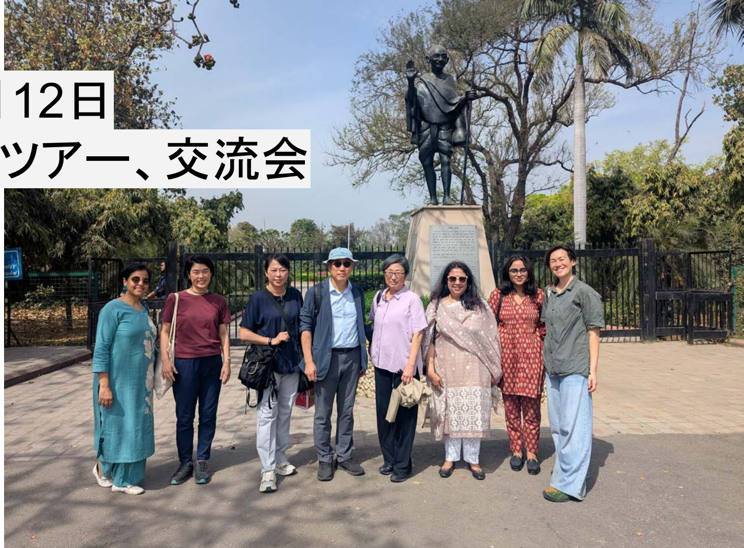
デリー大学キャンパス内の ガンディー像の前での集 合写真