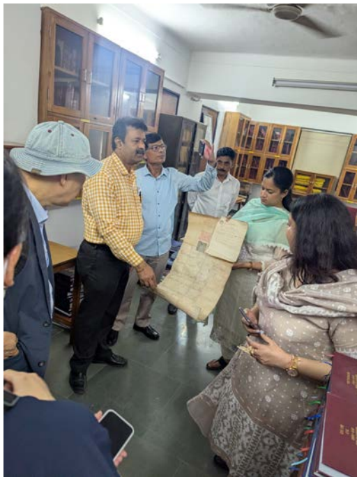
図書館のツアーで珍しい書籍を見る