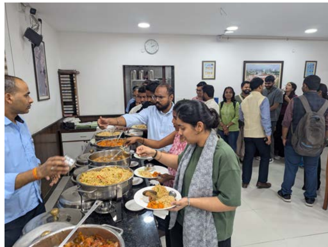
右上:デリー大学東アジア研究科の講師との交流 右下:ランチ