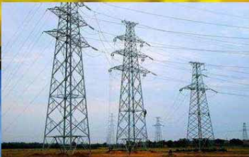
CCTV 13. 七纵四横两网格“高速公路充电网”