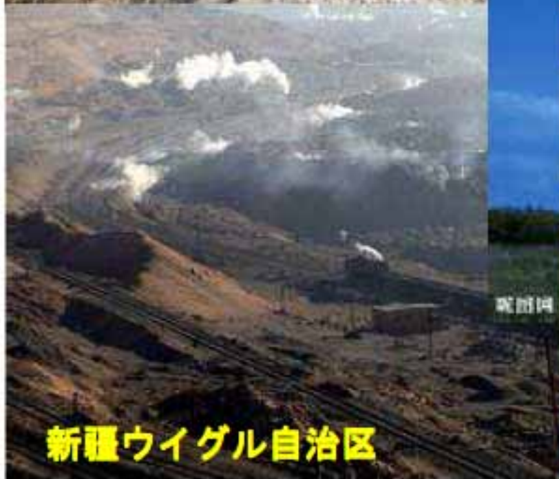
新疆ウイグル自治区