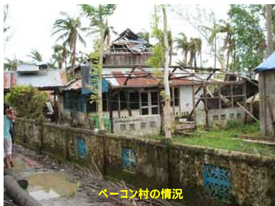
ペーゴン村の情況