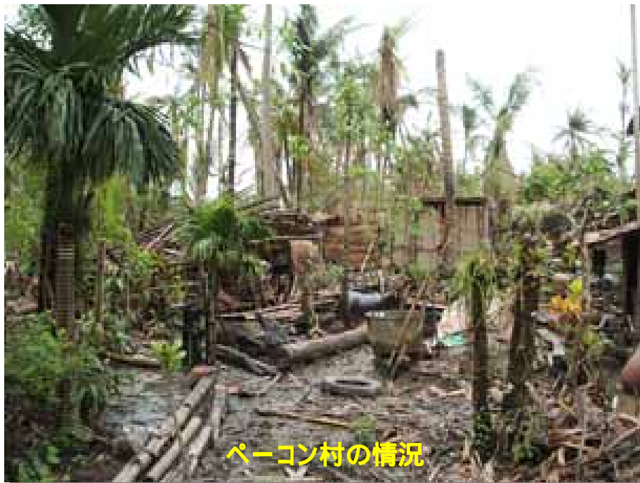
ペーゴン村の情況