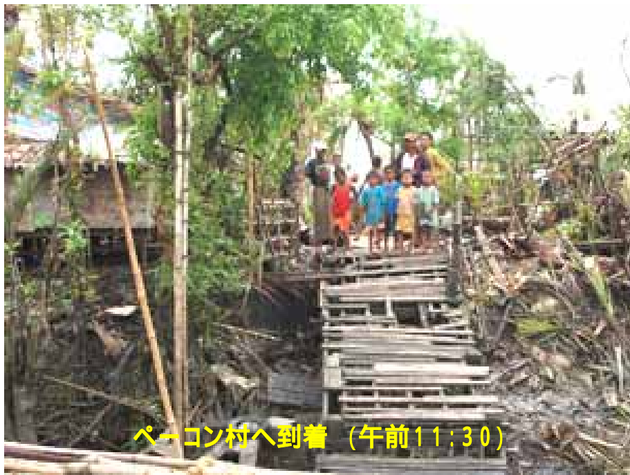
ペーゴン村へ到着 (午前11:30)