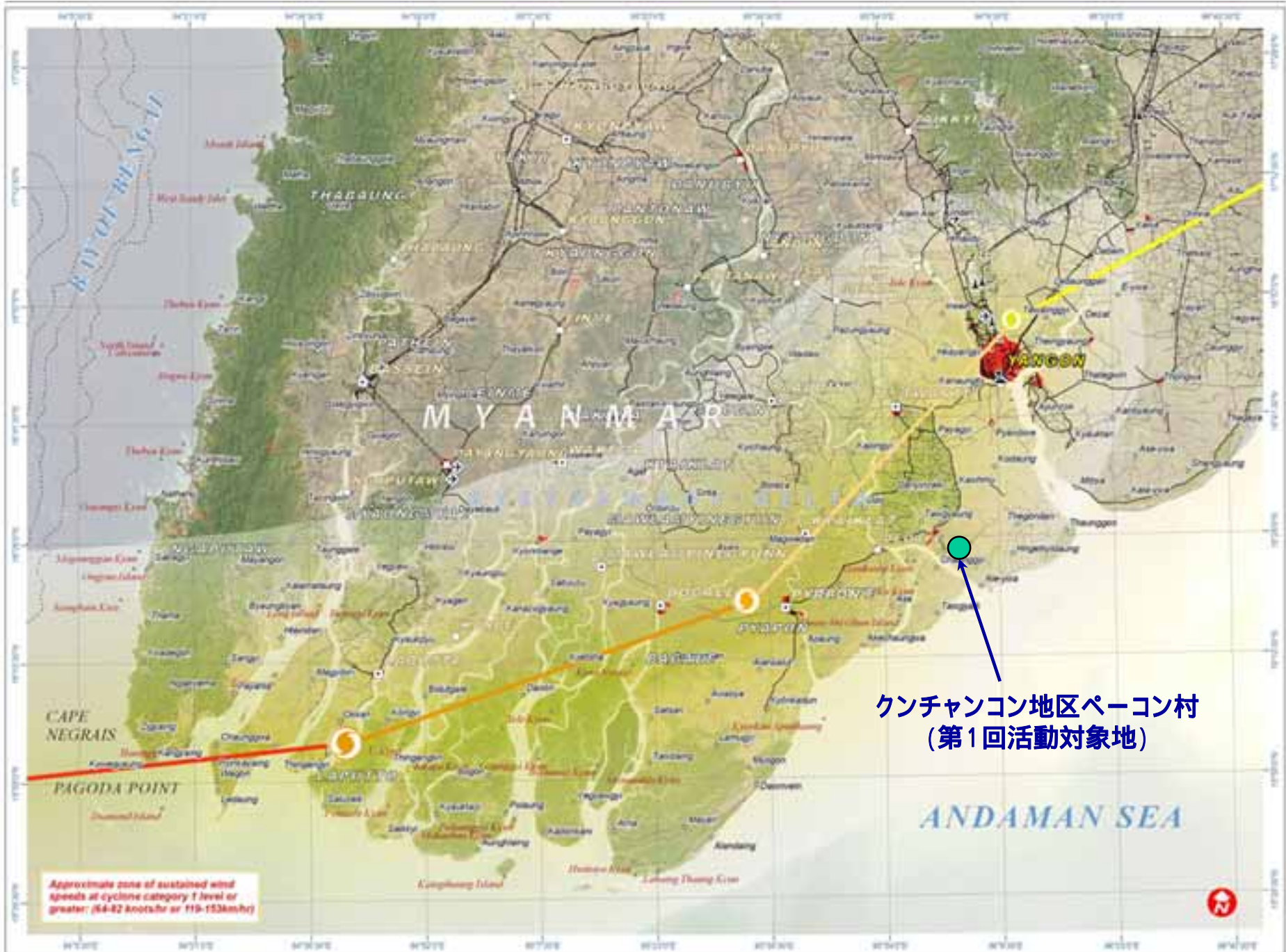
クンチャンコン地区パーコン村 (第1回活動対象地)