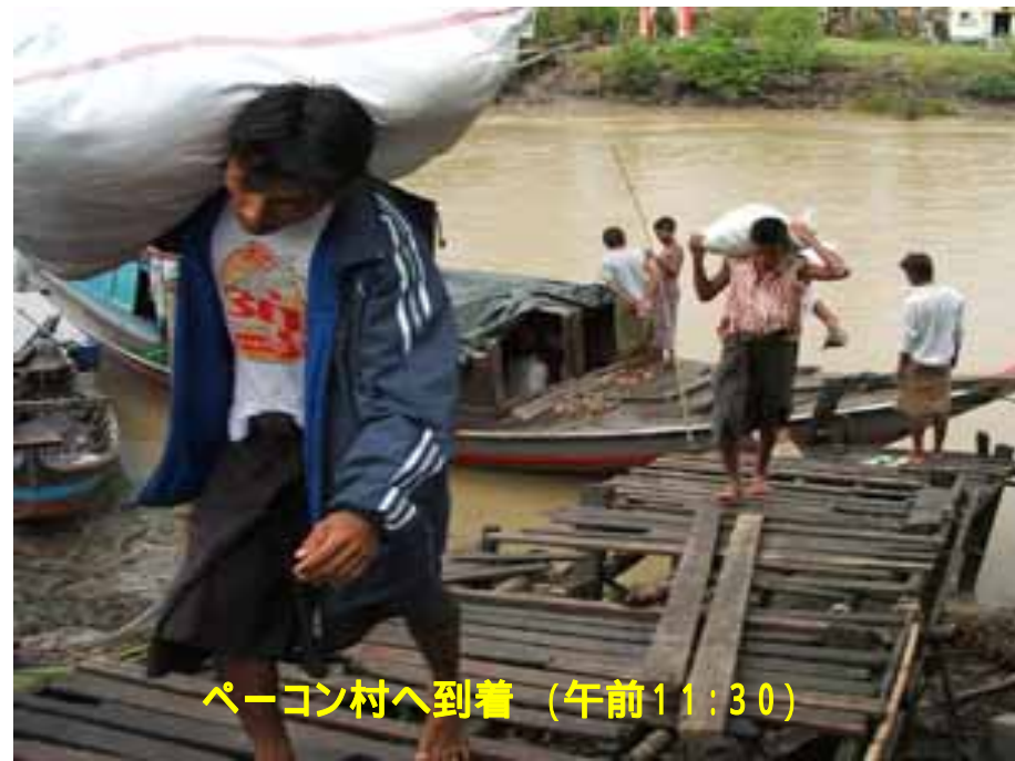
ペーゴン村へ到着 (午前11:30)