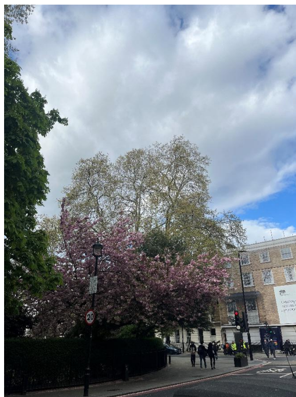
【ロンドン 街中の桜】

そのほか、学会全体としては、ウクライナに関する社会的・文化的諸問題に関するパネルが多く、ヨーロッパにとってウクライナ問題がいかに自国の安全保障問題と直結しているかを象徴しているかのようでした。